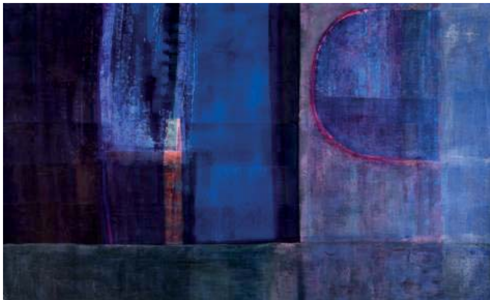
Kombinirana tehnika na akvarel papiru, format 150 x 250 cm