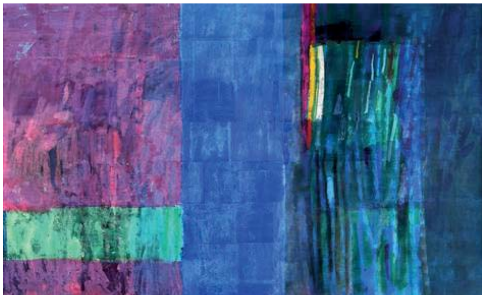
Kombinirana tehnika na akvarel papiru, format 150 x 250 cm