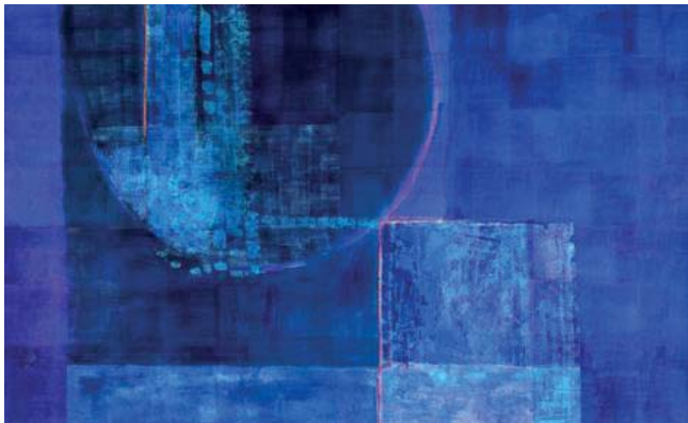
Kombinirana tehnika na akvarel papiru, format 150 x 250 cm